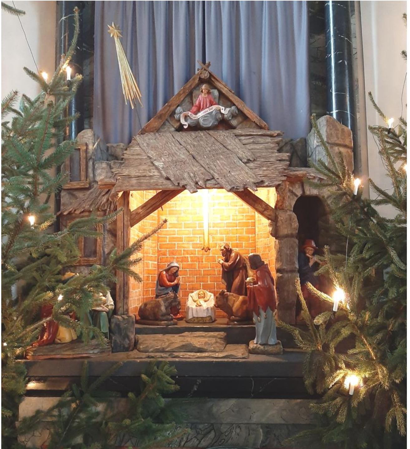
Krippe Pfarrkirche Aesch