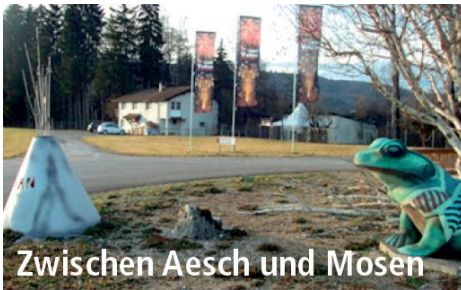
Zwischen Aesch und Mosen