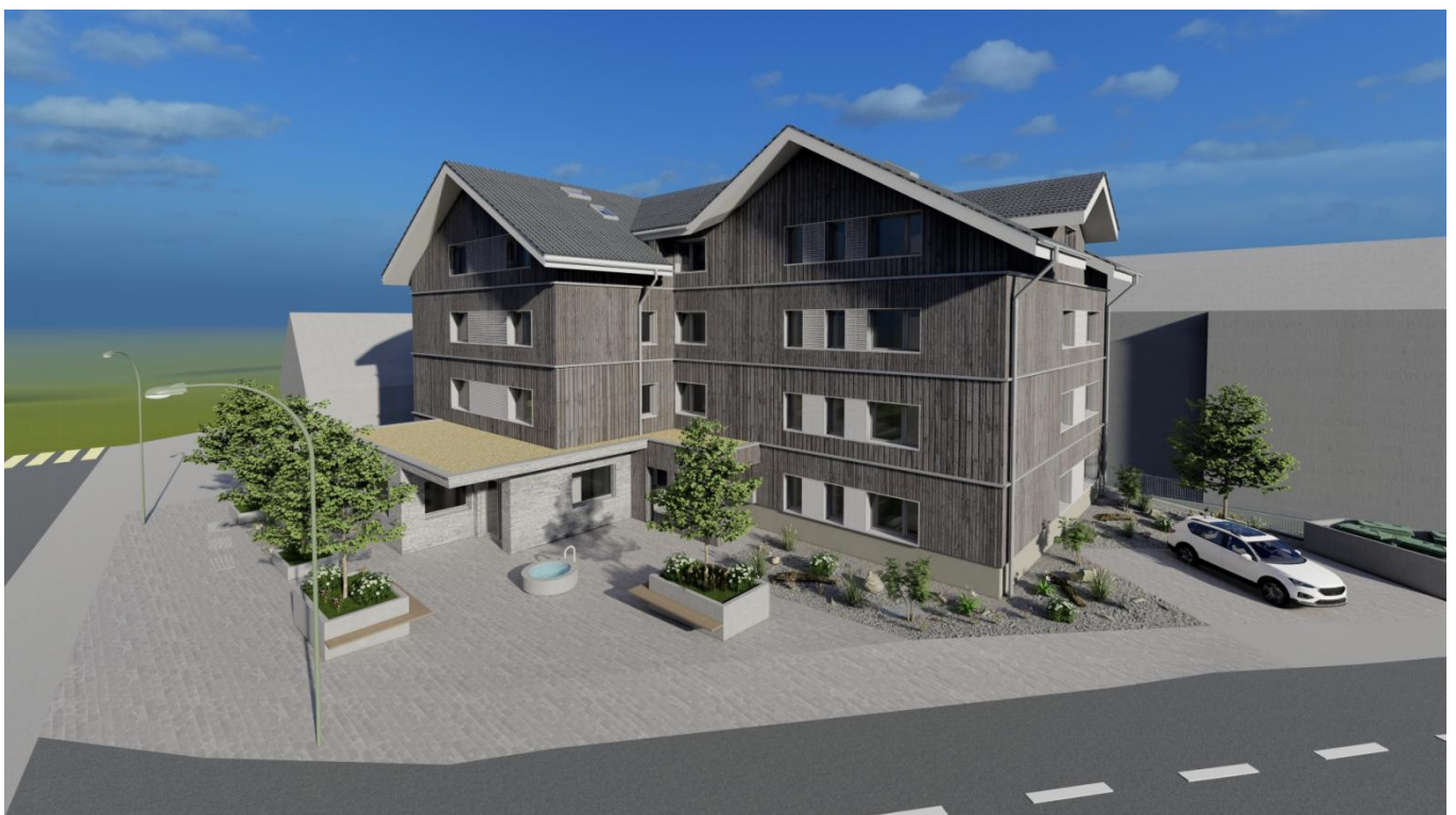
Visualisierung Ansicht Nord (von Kirchgasse)

Die Investition würde sich auf CHF 1'550'000 belaufen. Im Zusammenhang mit dem Schulhausneubau nochmals eine namhafte Investition, welche die erwartete Verschuldung nochmals anheben würde. Aufgrund der unerwarteten, vielversprechenden Chance sollte diese zusätzliche Investition trotzdem gewagt werden. Der Aufgaben- und Finanzplan für die nächsten 5 Jahre zeigt, dass auch diese Investition noch verkraftbar wäre. Details finden Sie in der ausführlichen Botschaft auf der Homepage der Gemeinde.