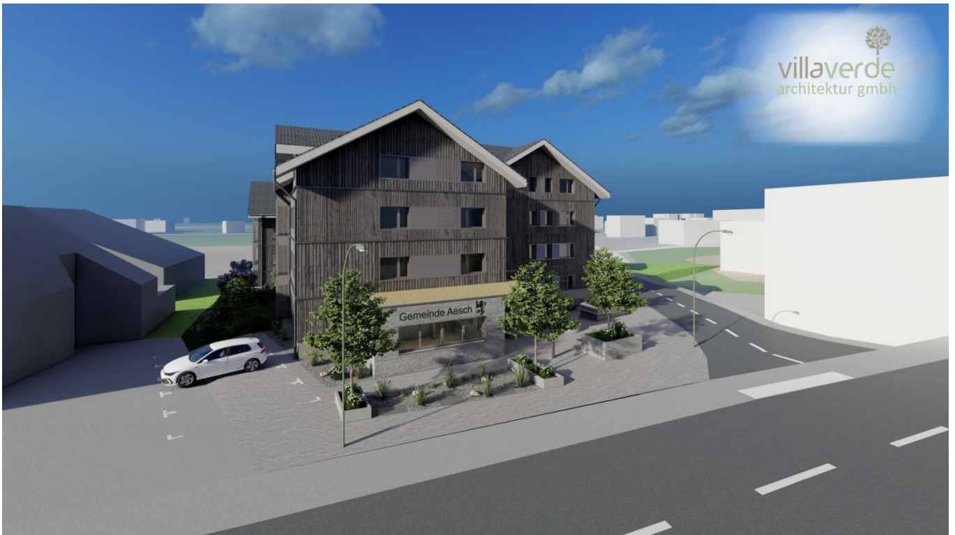
Visualisierung Ansicht Ost (von Hauptstrasse)