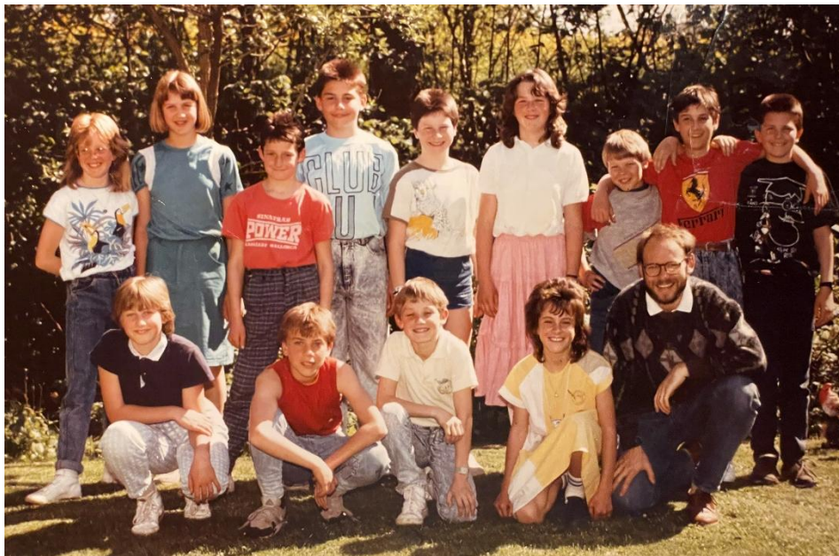
6. Klasse 1988

Der Jahrgang 1975 traf sich am 23. September 2023 zum Klassentreffen in der Brauerei Chällerbröi in Aesch. Gespannt durften wir den leidenschaftlichen Erläuterungen des Braumeister Raphi über die Braukunst zuhören. Natürlich wurden die unterschiedlichen Biersorten auch ausgiebig degustiert. Anschliessend wurden wir im Rest. Kreuz Aesch zum Znacht erwartet. Dieser Abend wird uns allen in bester Erinnerung bleiben. Als von früheren Episoden erzählt wurde, mussten wir uns die Bäuche vor Lachen halten und nicht selten hatten wir Lachtränen in den Augen. Herzlichen Dank dem OK, dass Ihr die Initiative für ein Treffen ergriffen habt. Es wurde selten so viel gelacht.