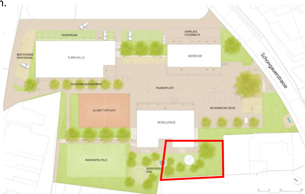
Bild: Situationsplan Neubau Schulanlage, rot: ungefähre Lage Parzelle Nr. 911

Mit der vorliegenden Teilrevision Ortsplanung wird die Parzelle Nr. 911 Grundbuch Aesch von der Wohn- und Gewerbezone (WG) in die Zone für öffentliche Zwecke umgezont. Die Änderung ist im Zonenplan Teilrevision 1:500 vom 7. Juli 2023 zu entnehmen.